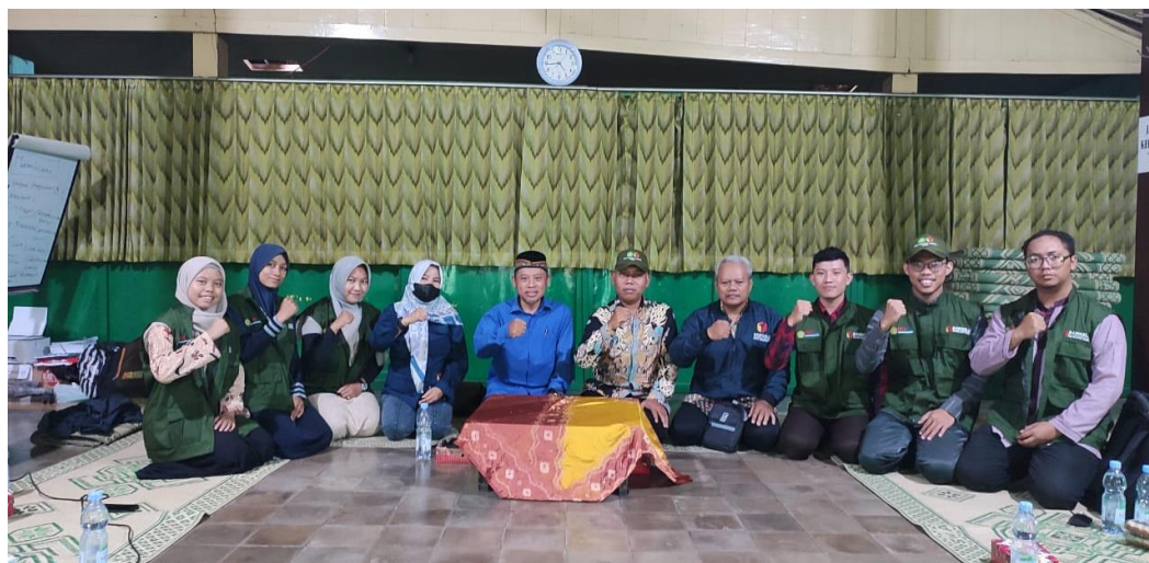
Gambar: 1 Rapat koordinasi pelaksanaan workshop dengan Pengawas Pemilu

merumuskan strategi dan rencana detail untuk pelaksanaan workshop " Pemberdayaan Pemilih Pemula dalam Pengawasan Partisipatif Pemilu 2024 di Kelurahan Jayengan Kecamatan Serengan Kota Surakarta " yang akan dilaksanakan pada tanggal 30 Januari.